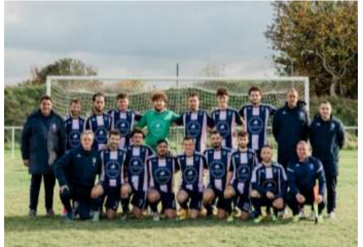
Ci-dessus, l'équipe séniors 1, avant sa victoire 8-0 contre ESNA

Le foot est rassembleur. N'hésitez pas à venir soutenir vos équipes de Torvilliers.