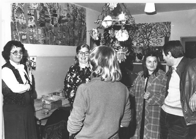
Noël à l'école maternelle